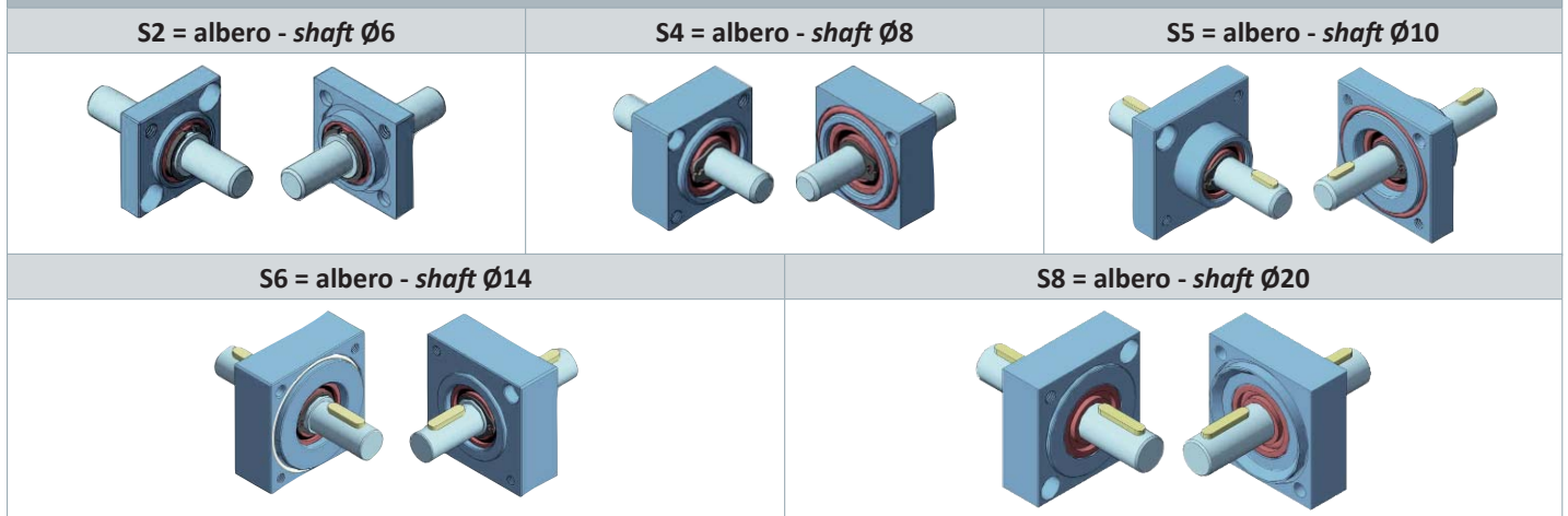
MODELLI DISPONIBILI - AVAILABLE VERSION